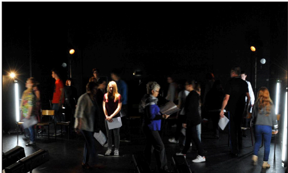
Depuis lundi, les répétitions s'enchaînent au théâtre de Thionville pour les 21 acteurs amateurs inscrits dans le dispositif Contre-courants 3.