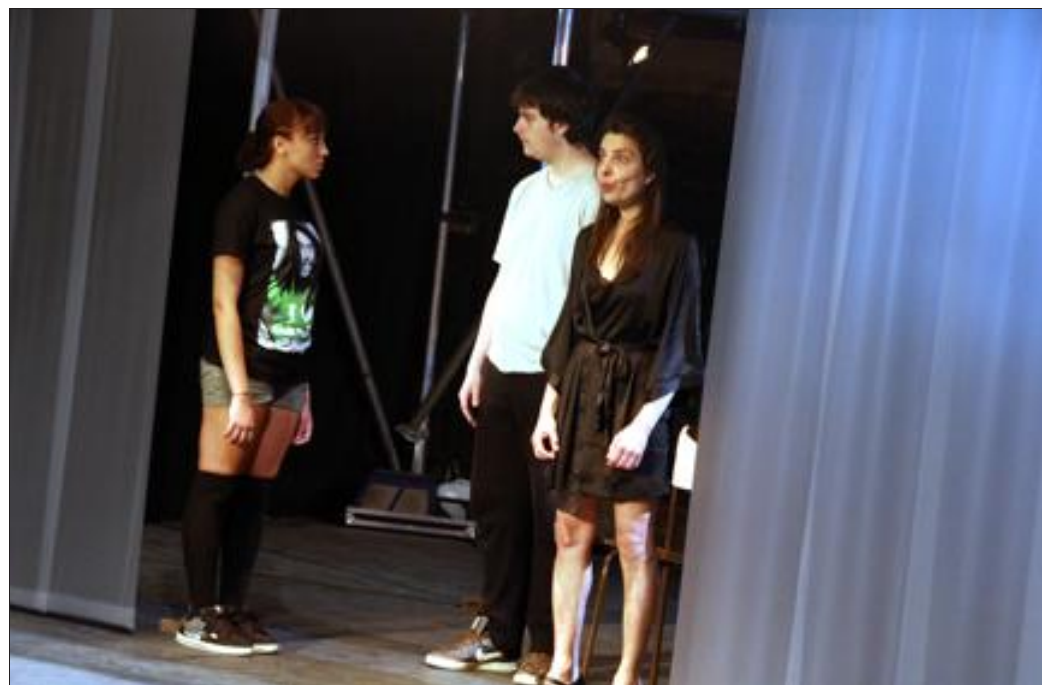
Les répétitions s'enchaînent au Théâtre en Bois depuis lundi. Comédiens en herbe et professionnels travaillent sur la pièce Les Enfants, d'Edward Bond.